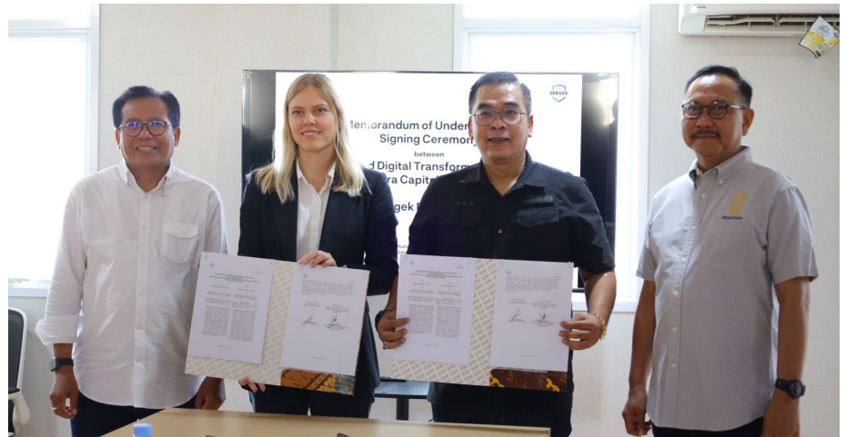
Penandatanganan MoU pengusaha Kazakhstan dengan Otorita IKN.

Mereka juga sempat singgah di kampung budaya Desa Pampang