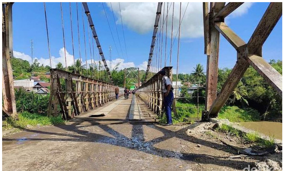
Jembatan Andalan Pacongkang sebelum diperbaiki.

Yang membuat jembatan ini luar biasa, lantaran jembatan yang menelan anggaran Rp75 miliar ini, bukan hanya menjadi jalan penghubung yang vital, tetapi juga sebuah simbol kemajuan dan keselamatan menghadapi bencana alam. Pasalnya jembatan ini dibangun dengan teknologi anti gempa dengan