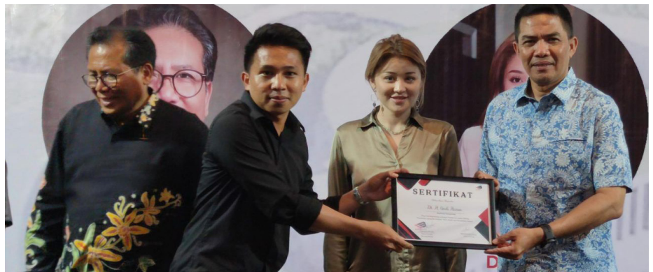
Dialog Nusantara Dubes, Duta Lingkungan Kazakhstan, dan Wali Kota Samarinda.

dan 3 orang di Tajikistan. Mereka berdiam di Kota Nur Sultan hingga Al Maty. Awal tahun 2022, Dubes sempat cemas karena terjadi kerusuhan di Kazakhstan gara-gara kenaikan harga bahan bakar.