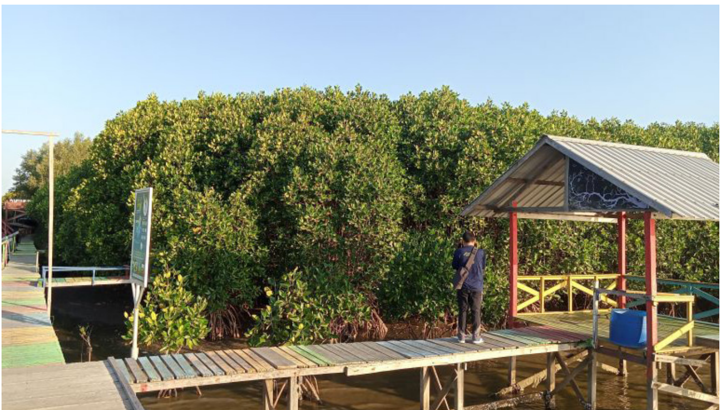
Kawasan mangrove di lokasi Ekowisata Lantebung, Kecamatan Tamalanrea, Kota Makassar