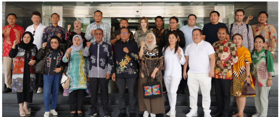
Foto bersama rombongan Dubes dan pengusaha Kazakhstan.

Tidak banyak orang Indonesia yang tinggal di negeri itu. Kira-kira hanya 140 orang di Kazakhstan