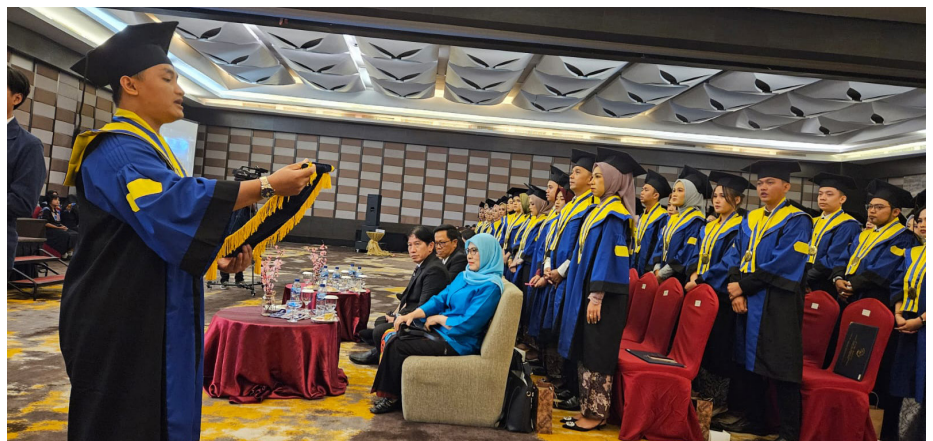
Pembacaan janji wisudawan dan wisudawati.