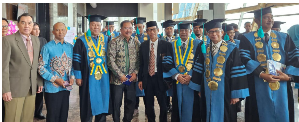
Foto bersama sesudah wisuda.