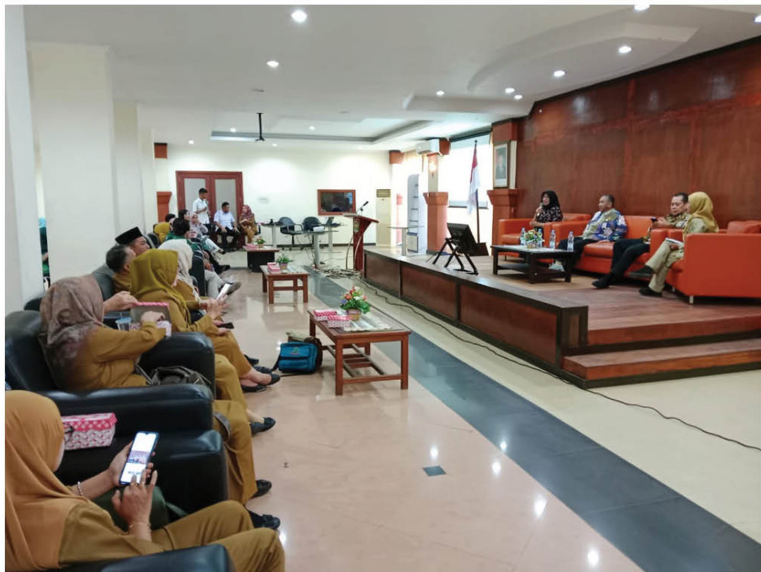
Bimtek Dinas Perpustakaan dan Kearsipan Daerah (DPK) Kalimantan Timur (Kaltim).

DINAS PERPUSTAKAN & KEARSIPAN KALIMANTAN TIMUR