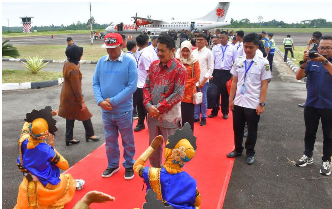
Rombongan Delegasi Komwil VI APEKSI Tiba di Kota Palopo, (13/9)

Lokakarya APEKSI Komwil VI 2023 di Kota Palopo diharapkan dapat menjadi ajang kolaborasi dan berbagi pengetahuan antara pemerintah kota-kota di Indonesia dalam upaya meningkatkan kualitas kesehatan masyarakat. (Hms/KS)