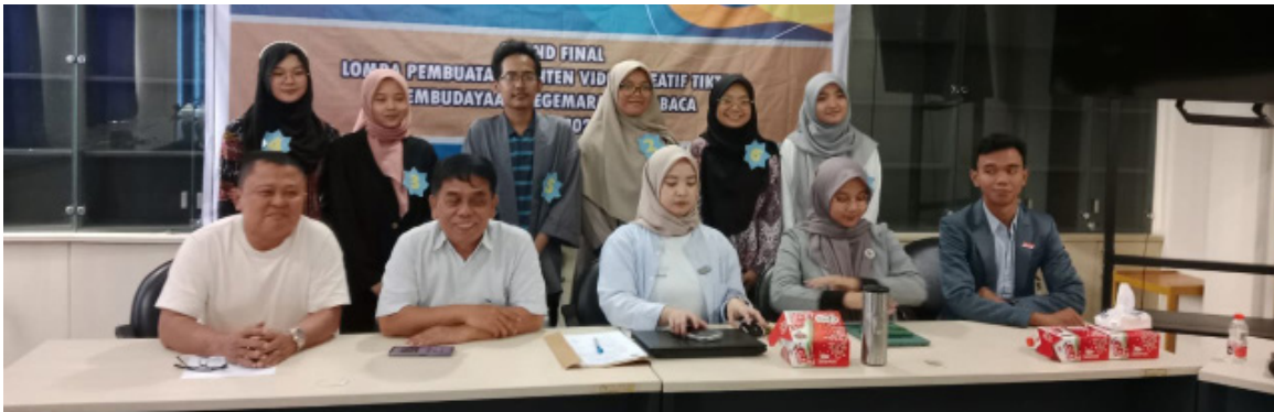
Sesi foto bersama Dewan Juri, Panitia dan Peserta Lomba Karya Video Kreatif Tiktok