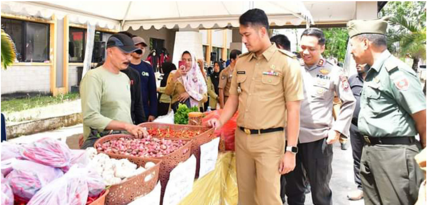
Bupati Sinjai ASA dalam memberikan Sambutan di Halaman Gedung Pertemuan Sinjai, Selasa (12/9)