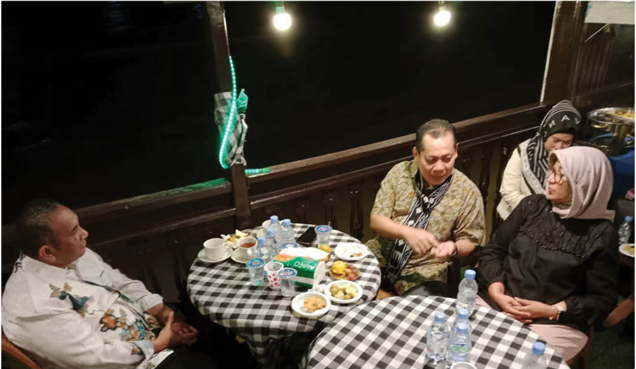
Suasana rapat antara ANRI dan DPK Kaltim di atas kapal Pesut Etam.