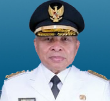
Dr. H. Ir. Isran Noor, M.Si GUBERNUR KALTIM